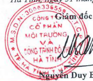
Nguyễn Duy Bằng

(Các thuyết minh từ trang 06 đến trang 25 là bộ phận hợp thành của Báo cáo tài chính này)